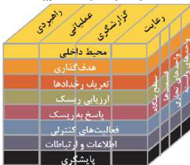
شکل ۲- مدل مکعب ریسک بنگاه کوزو

همچنین کوزو معتقد است، تقریباً هر عنصر می‌تواند بر عنصر دیگر اثر بگذارد. مدل مکعب مدیریت ریسک بنگاه کوزو (شکل ذیل) قصد نمایش روابط بین این عناصر، اهداف سازمان و ساختار سازمان را دارد. به این ترتیب این مدل به ویژه در ترسیم کامل نقطه پایان تصویر مدیریت ریسک بنگاه قوی است. سه بعد این مکعب بازتاب‌دهنده و مرتبط با عناصر مدیریت ریسک، اهداف کسب و کار سازمان و ساختار سازمانی آن است و تصویر کاملی را ترسیم می‌کند. همچنین، ساختار سه بعدی مکعب کوزو توجه به بخش‌های چارچوب در زمان اجرا را تسهیل می‌کند [۵].