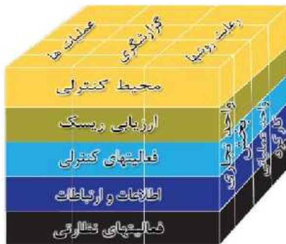
شکل ۳- مدل مکعب کنترل داخلی کوزو

شکل زیر رابطه بین اهداف و اجزای کنترل‌های داخلی و ساختار سازمان را نشان می‌دهد.